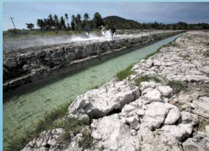
The King established the Pikun Thong Royal Development Center in Narathiwat to conduct innovative research into the process of soil acidification and to develop a way to improve the soil so that it would once again support crop production.

His Majesty the King’s patience and vision has created an elegant solution to a serious problem affecting the daily lives of millions of people. With plentiful natural resources, families no longer need to migrate to urban areas. Peace, prosperity, happiness and simplicity - key elements of the Thai way of life - are maintained in harmony.