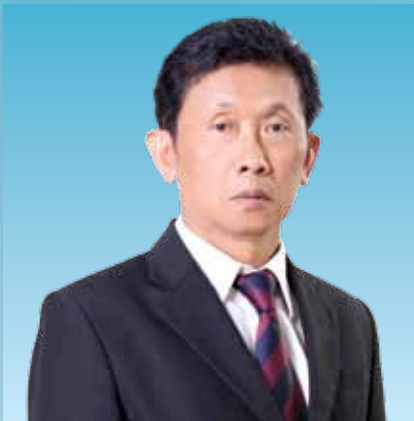
Dr. Pichet Durongkaveroj Minister of Science and Technology

Creative ideas and follow-up research and product development are crucial in ensuring ongoing sustainable progress and competitiveness within companies, organizations, industries and at the national, regional and international levels. Innovation can be regarded as an implementation of the creative ideas for the development of the country, in both economic and social aspects.